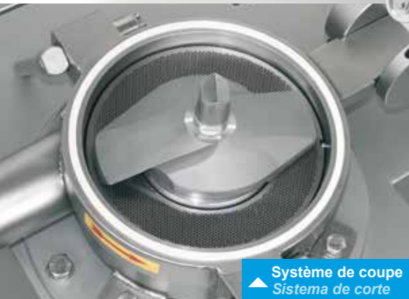
▲ Système de coupe Sistema de corte