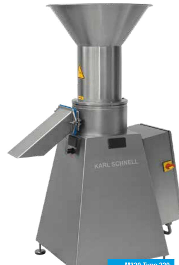
M320 Type 220 M320 Tipo 220