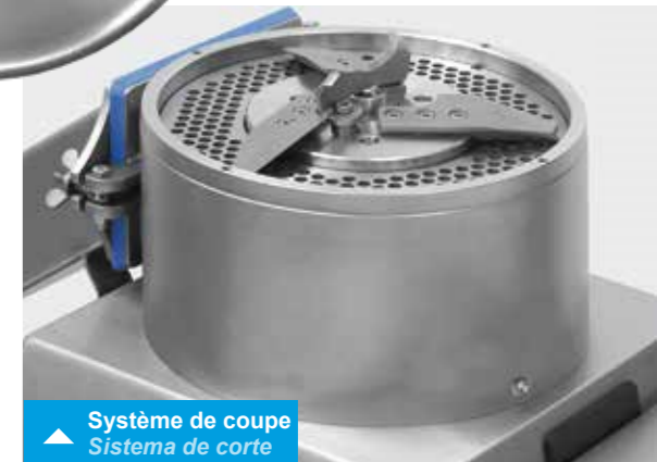
▲ Système de coupe Sistema de corte