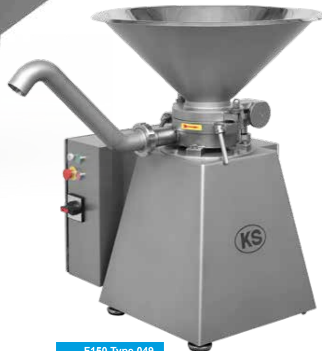
F150 Type 049 F150 Tipo 049