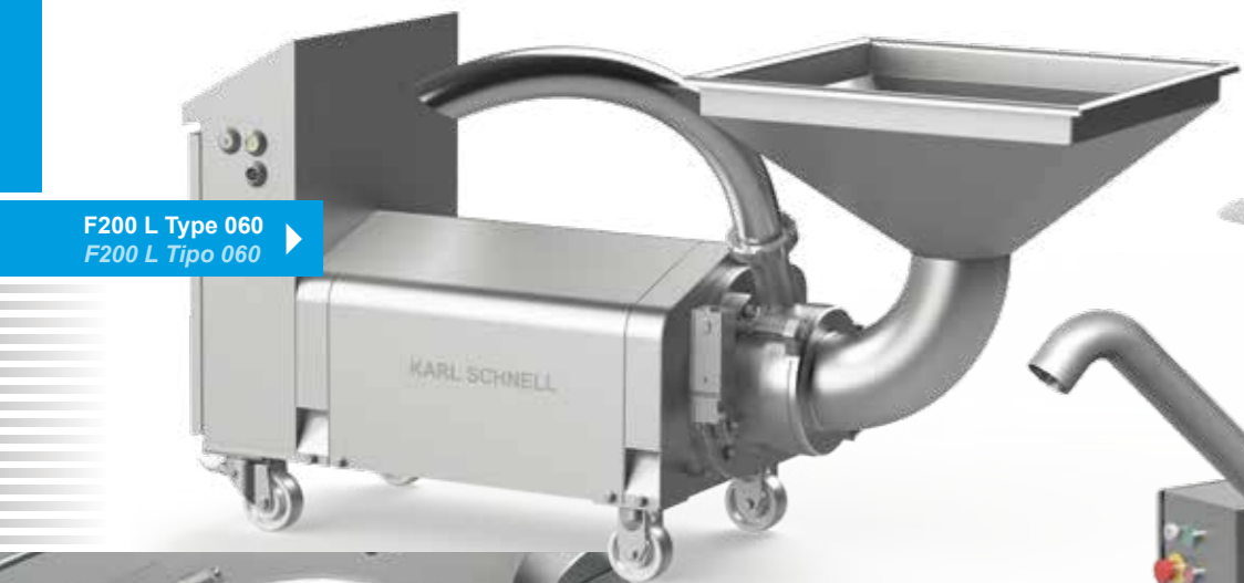
F200 L Type 060 F200 L Tipo 060

¡Versátil, duradera, fiable! Para el procesamiento de frutas, vegetales, partes de plantas, residuos orgánicos, etc., así como productos de la industria química.